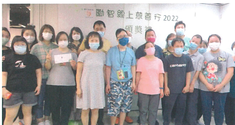
線上慈善行 2022 頒獎