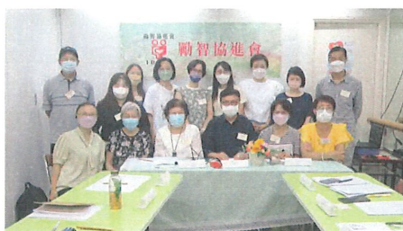
主持家長組織座談會