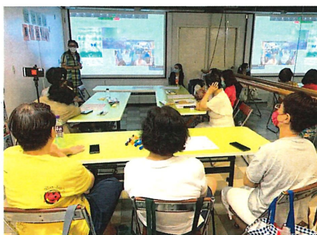
感作敢為新女性計劃