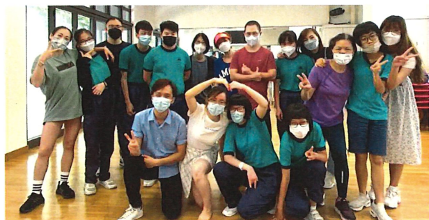
藝術園學校跳舞班