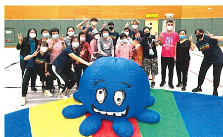
親子 Fun Fun 樂