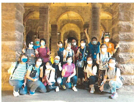
參觀深水埗主教山配水庫